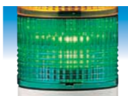
任何角度都具有高识别性