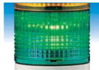
任何角度都具有高识别性