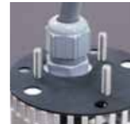
安装电缆密封套后实现IP66高等级防护